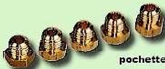
pochette de 5